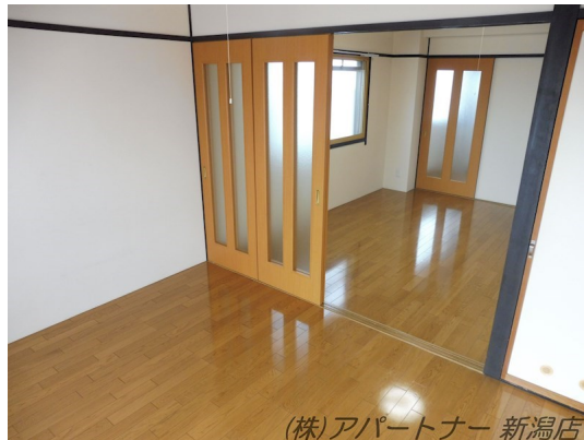
(株)アパートナー 新潟店

2F以上,ディンプルキー,角住戸,上階無し,当社管理物件,防犯カメラ,市街地に近い